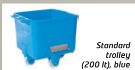
Standard trolley (200 lt), blue