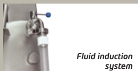
Fluid induction system