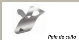
Pala de cuña